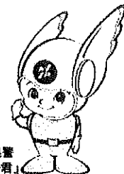
神奈川県警 「ビーガル君」